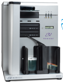
Desktop 2000i™ Made in USA